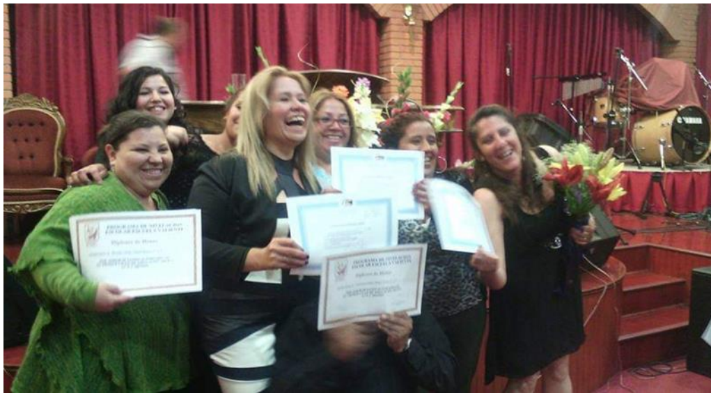
graduación año 2014 ...las mujeres de la sede 2 Casa de Dios