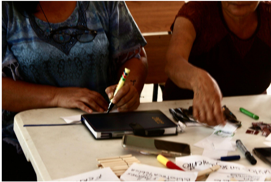
Fotografía 1. Materiales y proceso de escritura de los momentos importantes en la trayectoria, en fichas de papel.